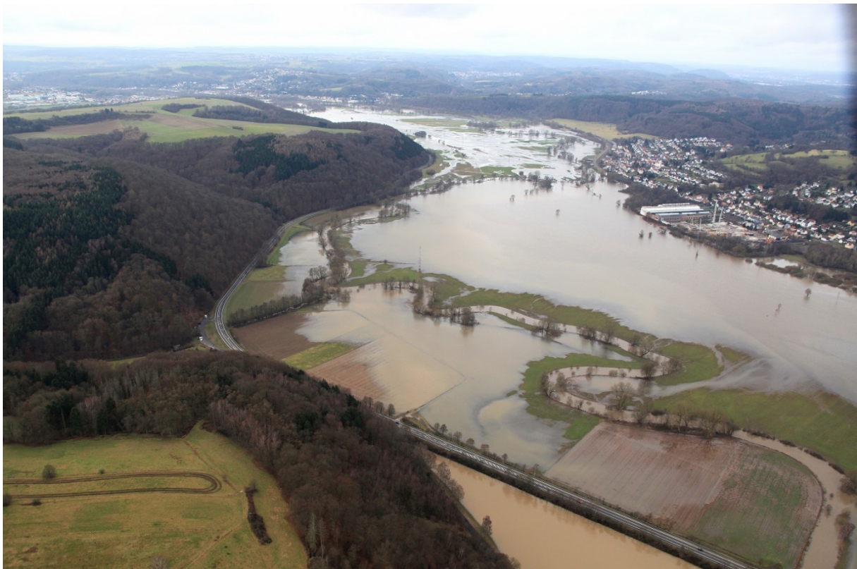
Überflutung der freien Landschaft

Ein Hochwasser ist ein natürliches Ereignis. Es gehört zum charakteristischen Abflussverhalten von Bächen und Flüssen und kann nicht verhindert werden. Hochwasser kann durch außergewöhnliche Niederschläge oder, bei uns seltener, durch schnelle Schneeschmelzen, ausgelöst werden. Gebiete in Gewässernähe sind daher von Natur aus durch Überflutungen bedroht und müssen mit dieser Gefahr zurechtzukommen.