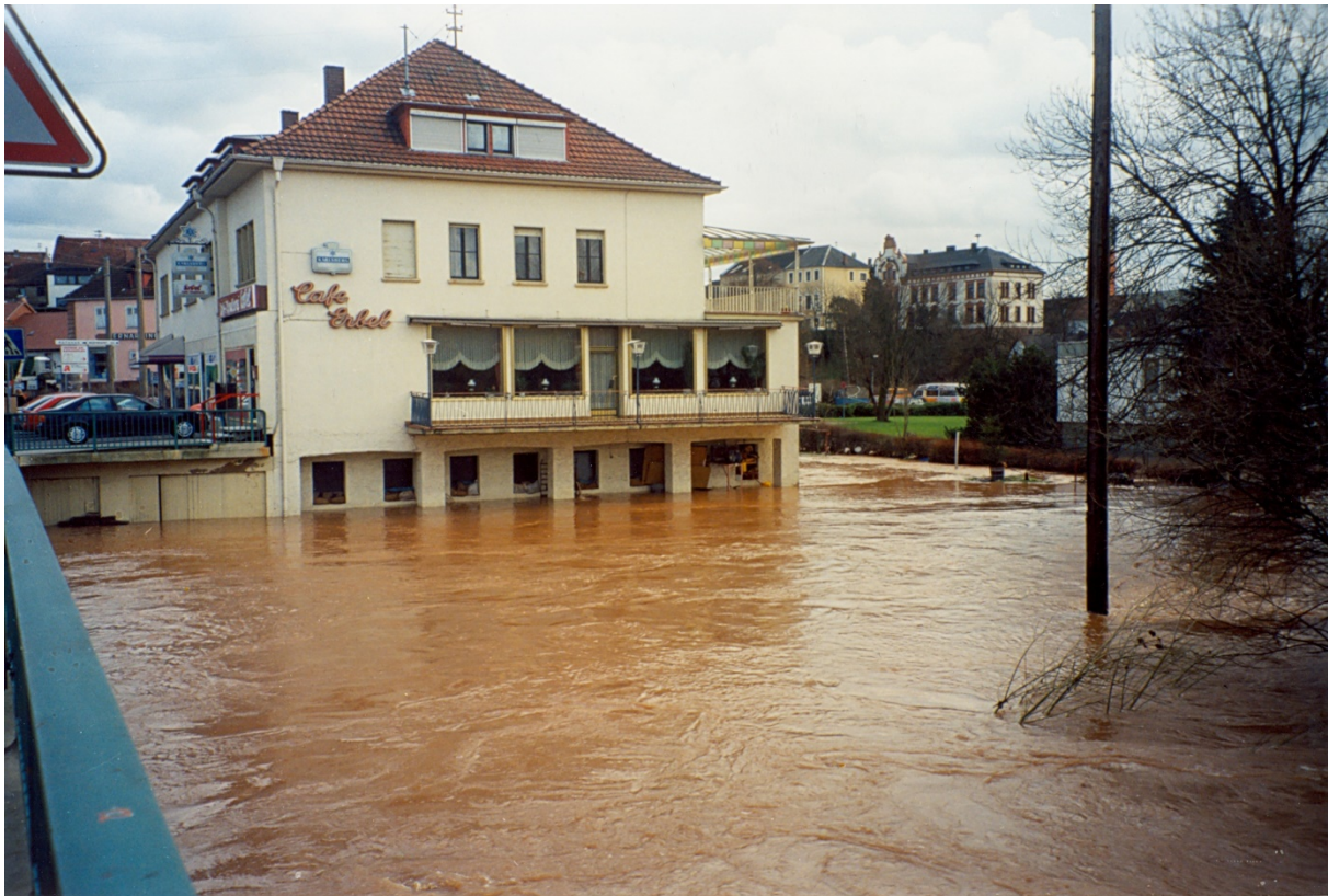
Schadenspotenzial durch Bebauung in den Überflutungsbereichen

Durch die starke Vernetzung der Infrastrukturen kann eine Überflutung auch Gebiete außerhalb der überschwemmten Flächen beeinträchtigen. So können zum Beispiel die Sperrung von Straßen, die Zerstörung von Versorgungsleitungen und die Unterbrechung der Stromversorgung dort Folgeschäden verursachen, wo gar keine Überschwemmung stattgefunden hat.