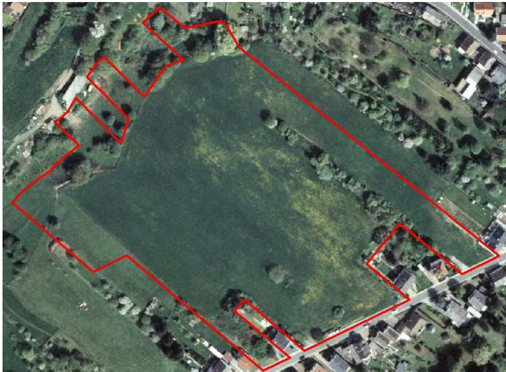
Abb. 1b: Geltungsbereich des B-Plans.